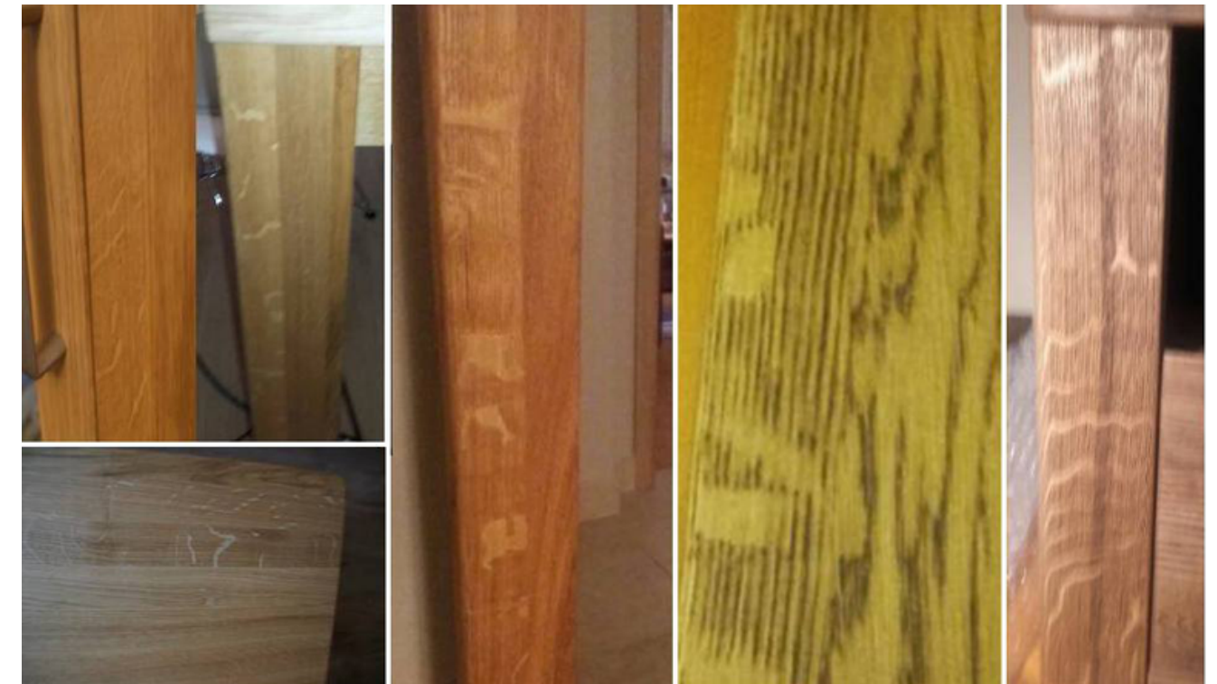
BŁYSZCZE W DĘBIE I BUKU

Można je także spotkać w laminatach naśladujących wygląd drewna, aby jak najbardziej odzwierciedlały rysunek naturalnego drewna.